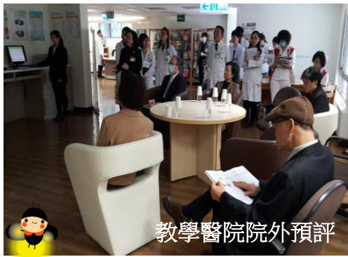
教學醫院院外預評