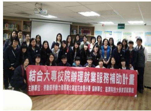
結合大專校院辦理就業服務補助計畫 主辦單位：勞動部勞動力發展署北基宜花金馬分署 協辦單位：慈濟科技大學就業服務組