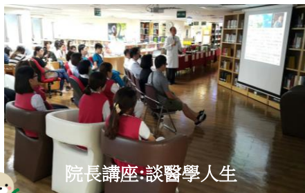
院長講座:談醫學人生