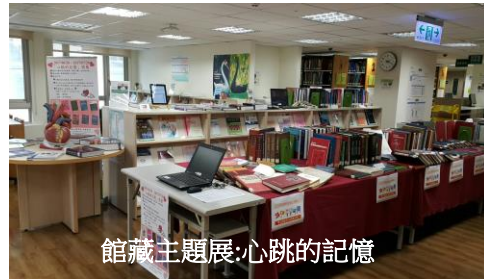
館藏主題展:心跳的記憶

Far Eastern Memorial Hospital Library E-paper